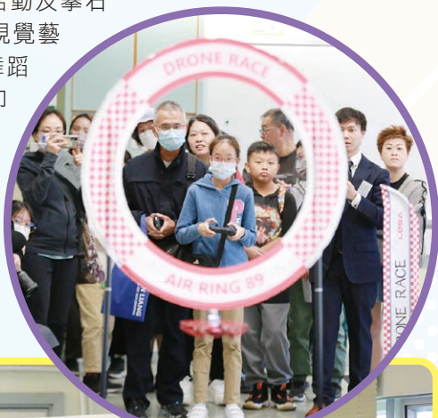
來賓模擬飛行駕駛