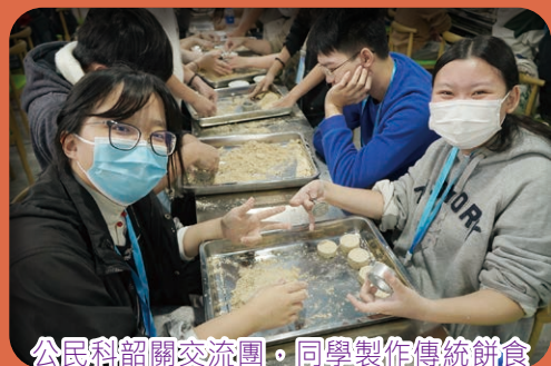
公民科韶關交流團，同學製作傳統餅食

在十月份接連的數星期，本校於課堂中播放利用這種嶄新的方式向大家展現不同學科與我國的非物質文化遺產相關的短片，然後各科再安排相關的延展活動，如：潮寫非遺（隨筆）、潮做非遺（長衫製作）、潮穿非遺（華服日）、潮食非遺（年糕製作）、潮聽非遺（中國戲曲欣賞）、潮奏非遺（中樂演奏）、潮踢非遺（踢毽子）、潮種非遺（二十四節氣有機種植）、潮選非遺（年度中國歷史人物選舉2023）、潮遊非遺（澳門、韶關考察團）……希望透過不同活動讓同學對不同中國非物質文化遺產有更深的認識，從而產生民族自豪感及自信心，培養同學尊重國家文化的態度及樂意肩負傳承的責任，積極協助維護國家文化安全。