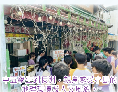
中五學生到長洲，親身感受小島的地理環境及人文風貌。