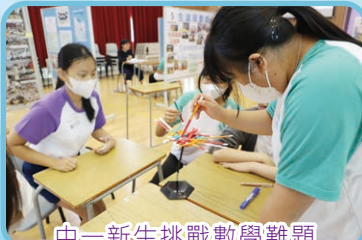
中一新生挑戰數學難題

成長帶來喜悅，同時充滿挑戰！中一新生從小學升上中學要面對新的學校，除了感到興奮，也許會感到擔心和迷惘。為了幫助中一新生盡快適應校園生活，本校在2023年8月14日至25日舉辦了為期十天的「中一迎新及銜接活動」。新生們除了參加七天的英文及數學銜接課程外，亦透過遊戲化學習，從數學遊戲日的多元活動加深對奧妙數學的認識。