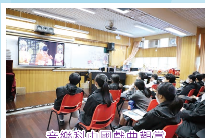
音樂科中國戲曲觀賞