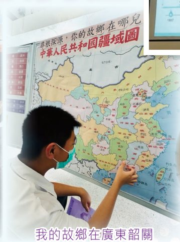
我的故鄉在廣東韶關