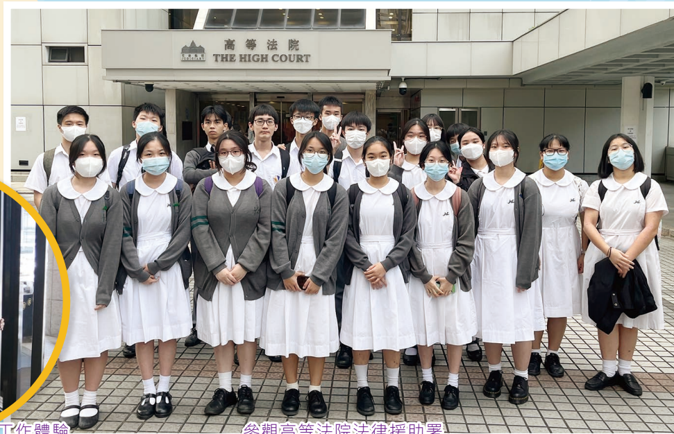
香港銅鑼灣皇冠假日酒店工作體驗