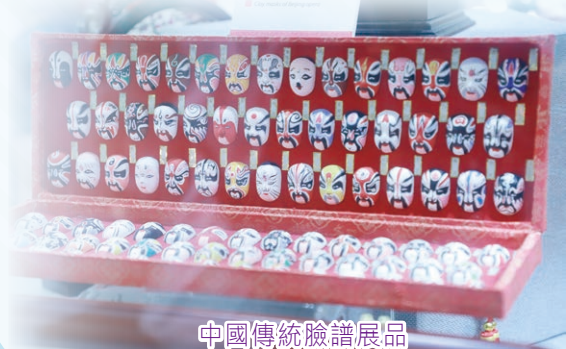
中國傳統臉譜展品

在十月份接連的數星期，本校於課堂中播放利用這種嶄新的方式向大家展現不同學科與我國的非物質文化遺產相關的短片，然後各科再安排相關的延展活動，如：潮寫非遺（隨筆）、潮做非遺（長衫製作）、潮穿非遺（華服日）、潮食非遺（年糕製作）、潮聽非遺（中國戲曲欣賞）、潮奏非遺（中樂演奏）、潮踢非遺（踢毽子）、潮種非遺（二十四節氣有機種植）、潮選非遺（年度中國歷史人物選舉2023）、潮遊非遺（澳門、韶關考察團）……希望透過不同活動讓同學對不同中國非物質文化遺產有更深的認識，從而產生民族自豪感及自信心，培養同學尊重國家文化的態度及樂意肩負傳承的責任，積極協助維護國家文化安全。