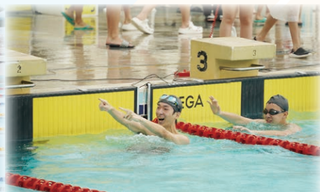
運動健兒自豪一刻