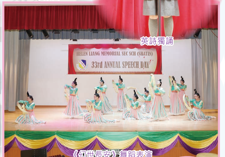
《幻世長安》舞蹈表演