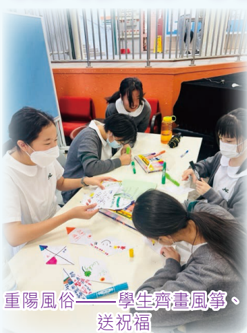
重陽風俗——學生齊畫風箏，送祝福