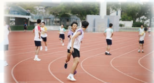
男子四社接力賽翹楚誰屬