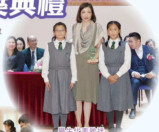
學生代表致送 紀念品予主禮嘉賓

是次典禮讓畢業同學帶着母校給予的誠摯關懷和祝福，開創理想的未來。典禮雖然短暫，但回憶和祝福是恆久而深刻的。