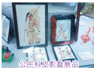
公民科皮影戲展品

為了將這風氣帶到校園，本校的中文科、公民、經濟與社會科、公民與社會發展科、中國歷史科、體育科、視藝科、音樂科及科技與生活科聯合舉辦了一個跨學科活動，名為「潮賞非遺」。