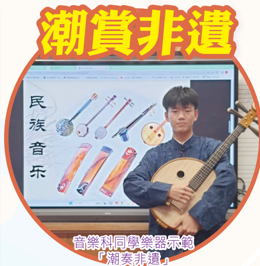
音樂科同學樂器示範「潮奏非遺」