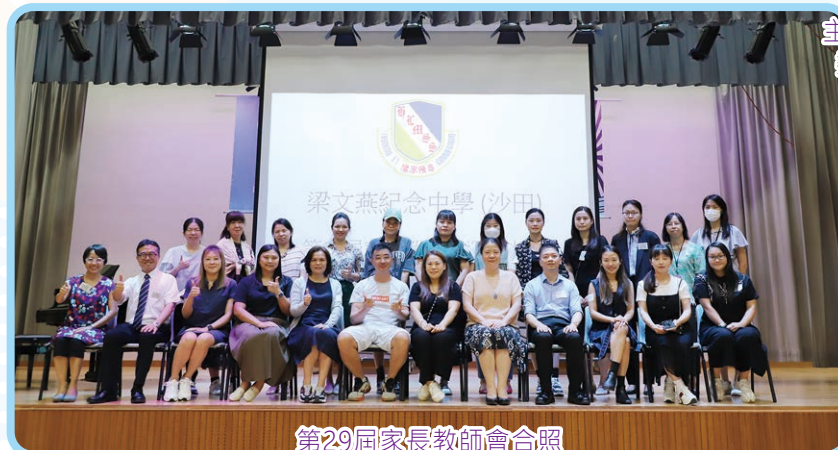
第29屆家長教師會合照

最後，家長與班主任分別在課室及禮堂面談，讓家長更深入了解學生在學校的情況。這次交流有助於建立家長、學校和孩子之間更緊密的合作關係，共同促進學生的全面發展和學習成就。