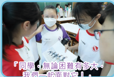
『同學，無論困難有多大。 我們一起面對它！』