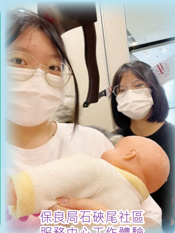
保良局石硤尾社區服務中心工作體驗