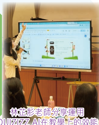
林芷彤老師分享運用 QUIZZ AI在教學上的效能