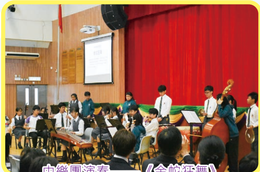
中樂團演奏——《金蛇狂舞》