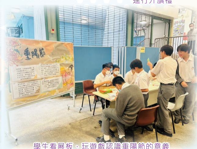
學生看展板、玩遊戲認識重陽節的意義