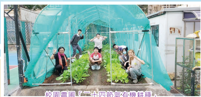
校園農圃「二十四節氣有機耕種」