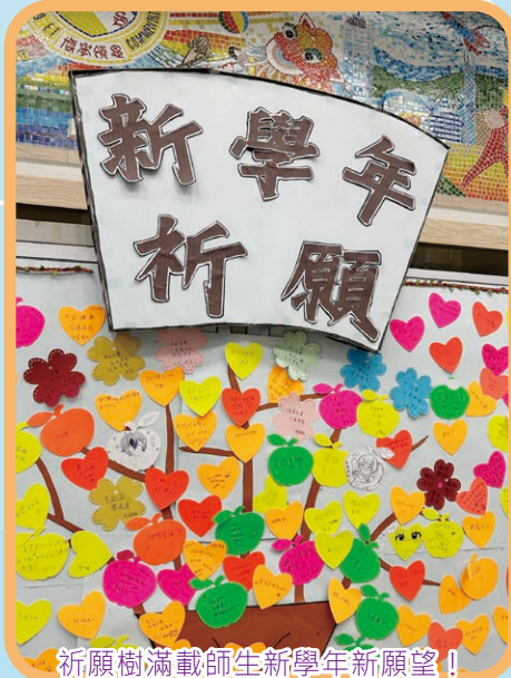
祈願樹滿載師生新學年新願望！