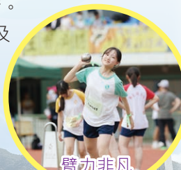
臂力非凡 英姿颯爽