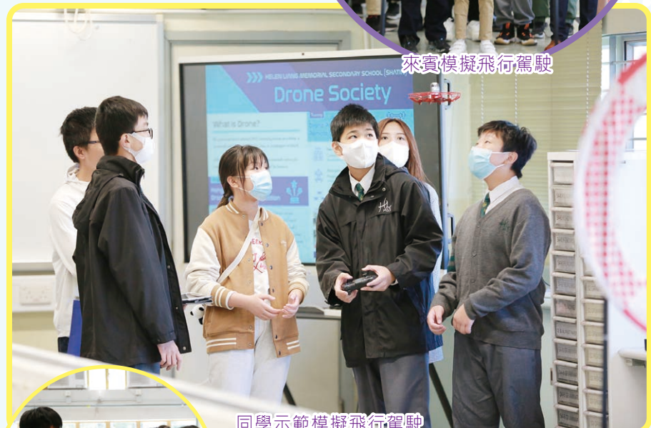
同學示範模擬飛行駕駛