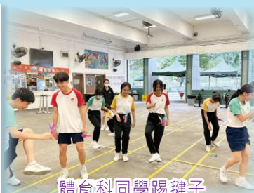
體育科同學踢毽子