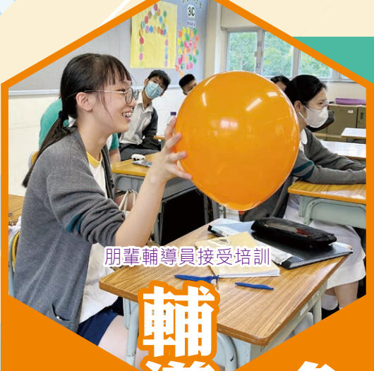
朋輩輔導員接受培訓