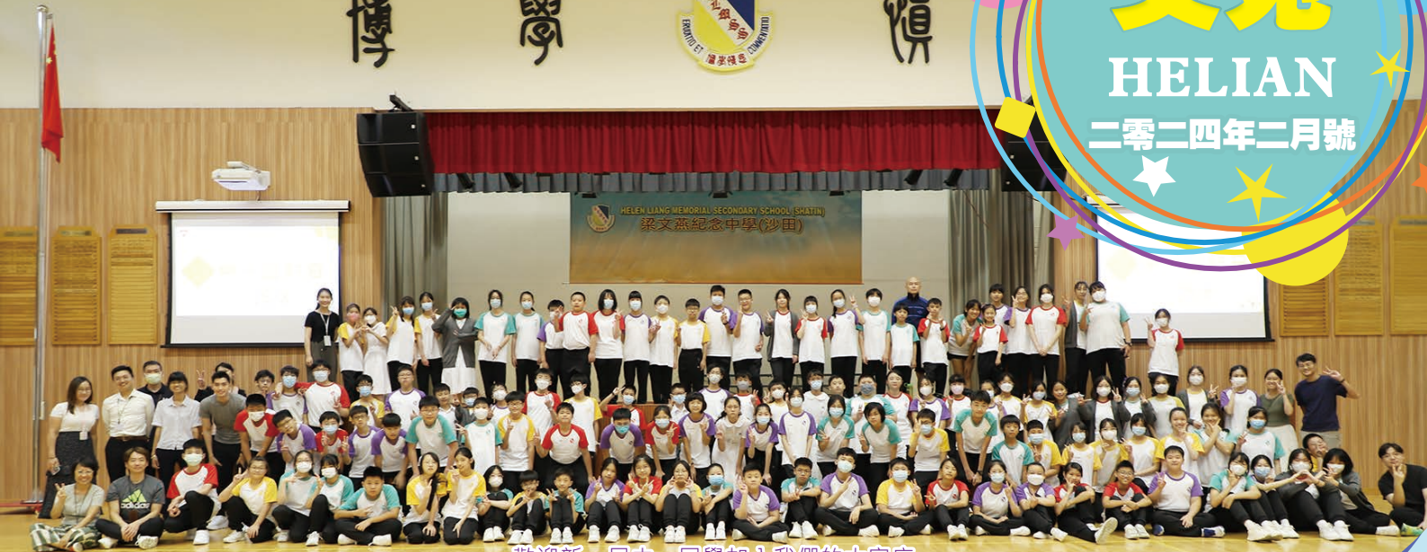
歡迎新一屆中一同學加入我們的大家庭