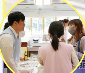
家政室內款待來賓