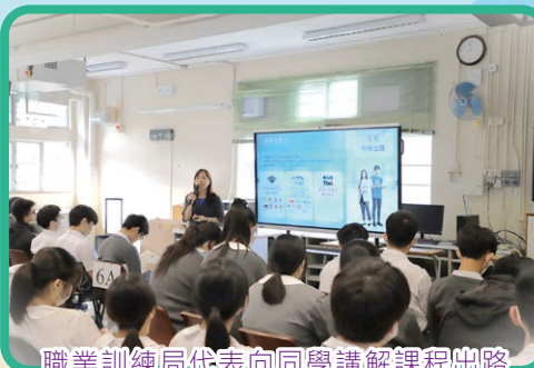
職業訓練局代表向同學講解課程出路