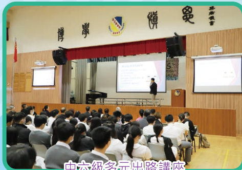
中六級多元出路講座