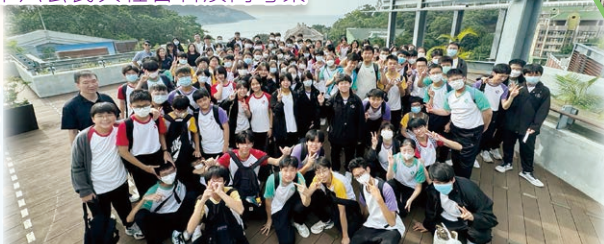
中二學生到赤柱感受小鎮氛圍，了解美利樓的歷史，欣賞參觀這揉合了東西方特色的建築。