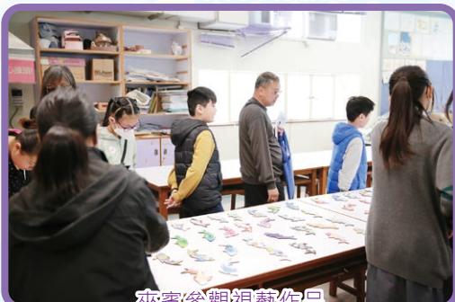
來賓參觀視藝作品