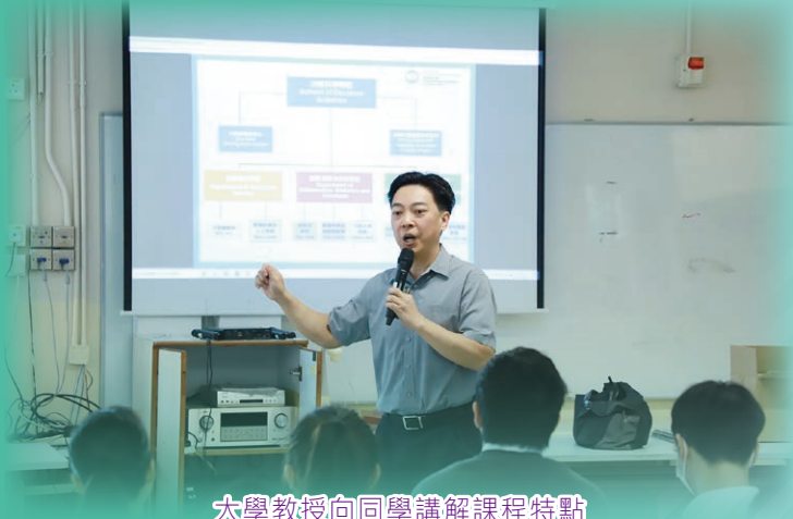
大學教授向同學講解課程特點

生涯規劃組透過安排不同類型的活動，培養學生認識自我、訂立目標、作個人規劃，以及認識銜接各升學就業及培訓途徑、職業操守及職場資訊。如高中學生多元出路及院校升學講座，讓高中學生及家長了解升學或就業選擇；工作體驗活動給予學生機會，到訪不同機構，獲取真實的職場體驗，幫助同學認識不同機構的實際運作和了解不同崗位的日常工作；本組亦積極推薦學生成為學生大使，如香港故宮文化博物館。透過執行及實踐，從而更加了解自己及職業性向，及早為人生作長遠規劃。