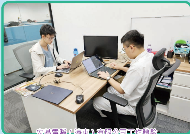
宏碁電腦（遠東）有限公司工作體驗