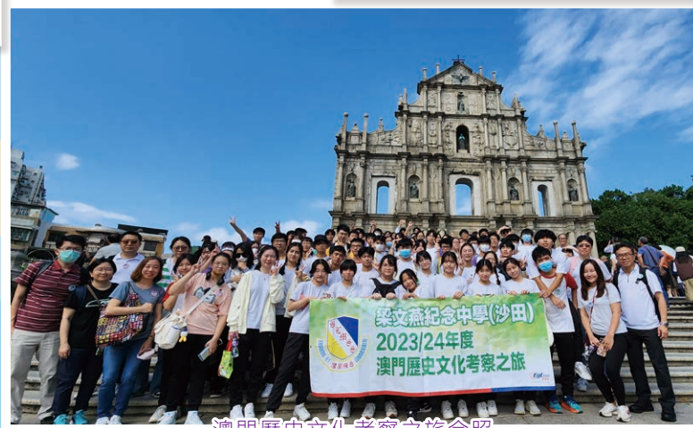
澳門歷史文化考察之旅合照