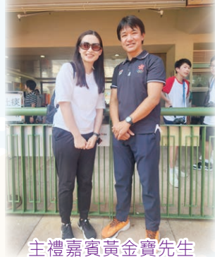
主禮嘉賓黃金寶先生

閉幕及頒獎禮邀請到三屆亞運公路單車金牌得主黃金寶先生蒞臨主禮及頒授獎項。黃先生在致辭時鼓勵同學投入運動，因為運動可以使人養成健康體魄，並提醒同學凡事需以謙卑和堅持的態度面對，循序漸進就可以實現所追隨的目標。最後，黃先生勉勵同學：運動其實是通過努力跟過去的自己競賽，因此勝敗並非關鍵，最重要的是從運動過程中得到啟發。在宏亮的校歌聲中，梁文燕紀念中學（沙田）2023-2024周年陸運會圓滿閉幕。