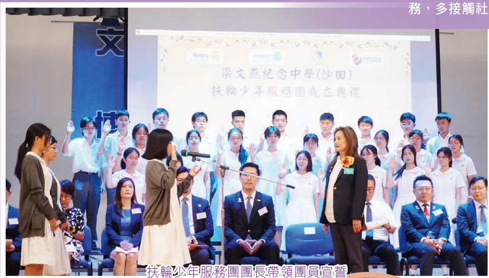
扶輪少年服務團團長帶領團員宣誓

扶少團的成立加強了學校在進一步推動多元化社會服務的工作，培養學生關心社區，透過籌劃及參與社區服務，多接觸社群，從而建立正向價值觀。