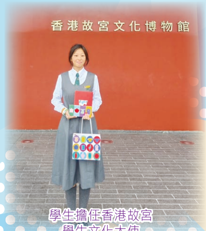
學生擔任香港故宮學生文化大使