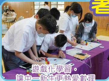
遊戲化學習。 讓中一新生更熱愛數學