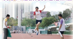
飛身一躍 敏捷如鹿