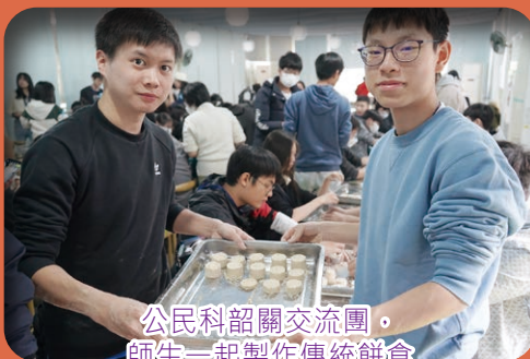
公民科韶關交流團，師生一起製作傳統餅食