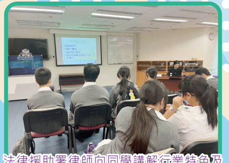
法律援助署律師向同學講解行業特色及入職要求