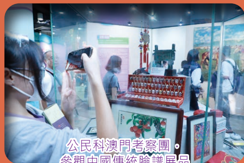
公民科澳門考察團，參觀中國傳統臉譜展品