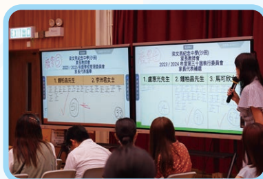
23-25年度學校管理委員會家長代表選舉和23-24年度第三十屆執行委員會家長代表選舉點票