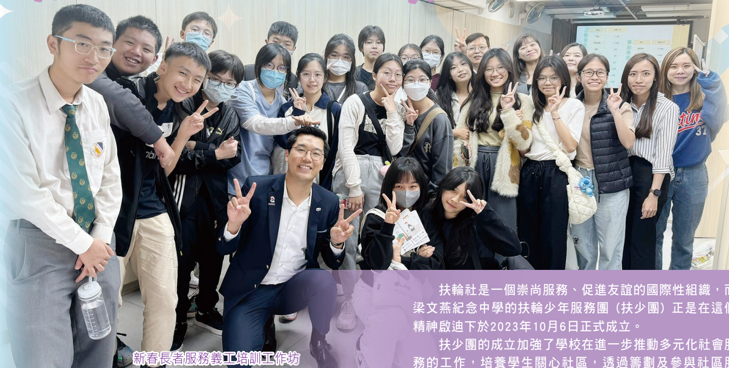
新春長者服務義工培訓工作坊

扶輪社是一個崇尚服務、促進友誼的國際性組織，而梁文燕紀念中學的扶輪少年服務團（扶少團）正是在這個精神啟迪下於2023年10月6日正式成立。