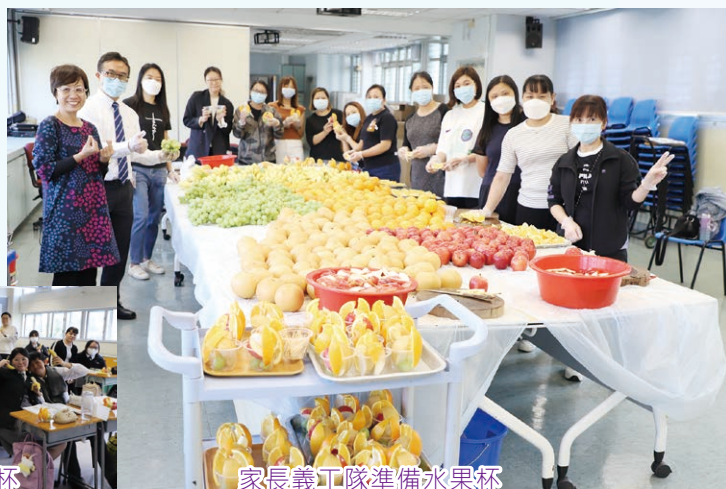
家長義工隊準備水果杯

學生們品嚐美味的水果之餘，了解水果的營養價值及對身體健康的重要。這樣的體驗不僅豐富了學生的知識，也培養了他們對健康飲食的意識。