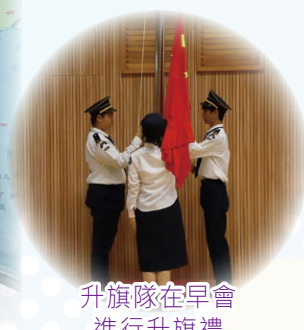
升旗隊在早會進行升旗禮