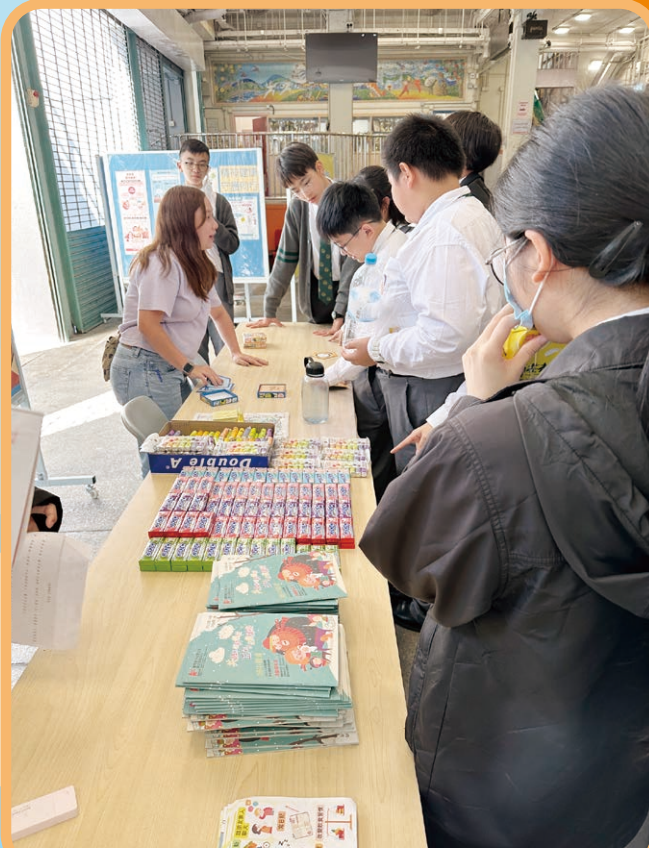
透過精神健康攤位遊戲，讓學生認識處理情緒妙法