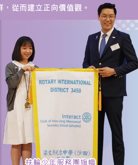
扶輪少年服務團旗幟